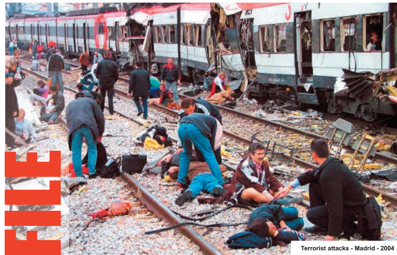
Terrorist attacks - Madrid - 2004