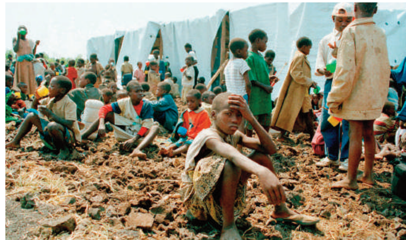
"Les victimes n'ont rien. Lorsqu'il s'agit d'elles, tous les prétextes sont invoqués pour ne pas les indemniser. Tandis que leurs bourreaux sont mis au beurre. Pour nous, c'est une prime à la délinquance."

C'est une situation très inquiétante, car elle est tributaire de l'insécurité entretenue à dessein par les groupes armés qui commettent de plus pires exactions sur la paisible population civile ; en dépit de