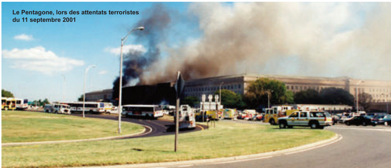
Le Pentagone, lors des attentats terroristes du 11 septembre 2001