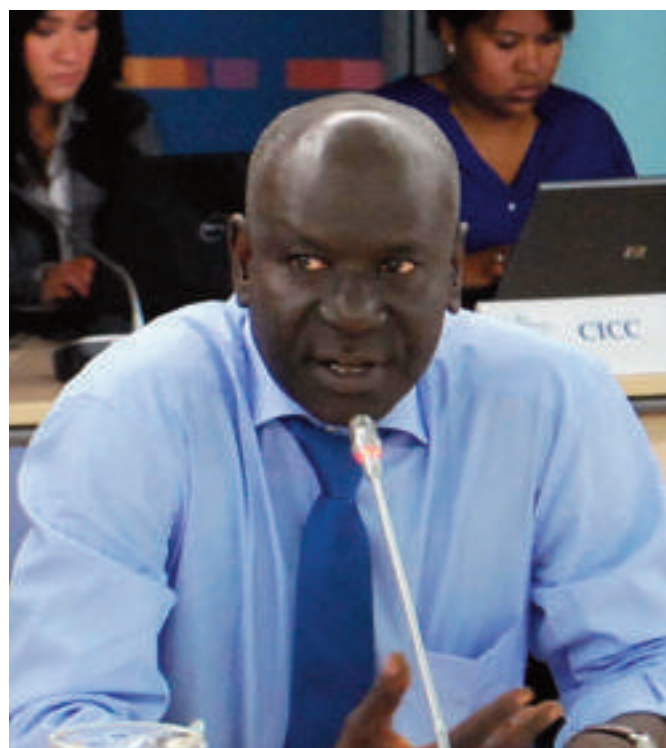
"We have jurisdiction over crimes of terrorism and cross-border crimes committed in certain contexts which may be placed under the scope of crimes against humanity or war crimes"