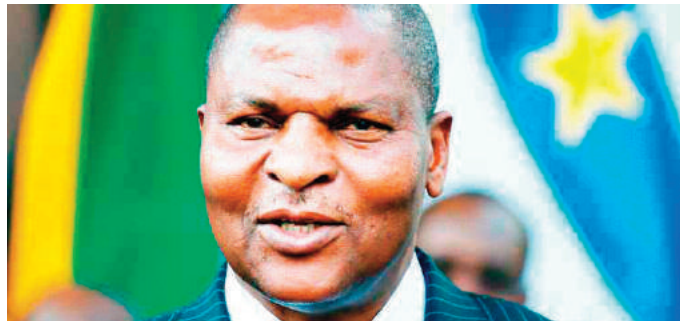
Central African Republic President Faustin-Archange Touadéra

There is also the case of Ngoudjolo Chui of the Demo-