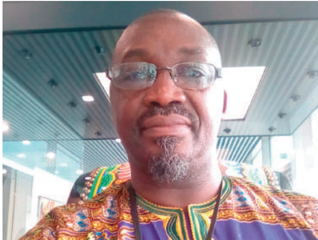
"La plupart des affaires pendantes devant la Cour aujourd'hui proviennent des pays africains à la demande des autorités desdits États"

Il faut d'abord préciser que l'adhésion au Statut de Rome est volontaire. Par conséquent, le retrait est aussi vo-